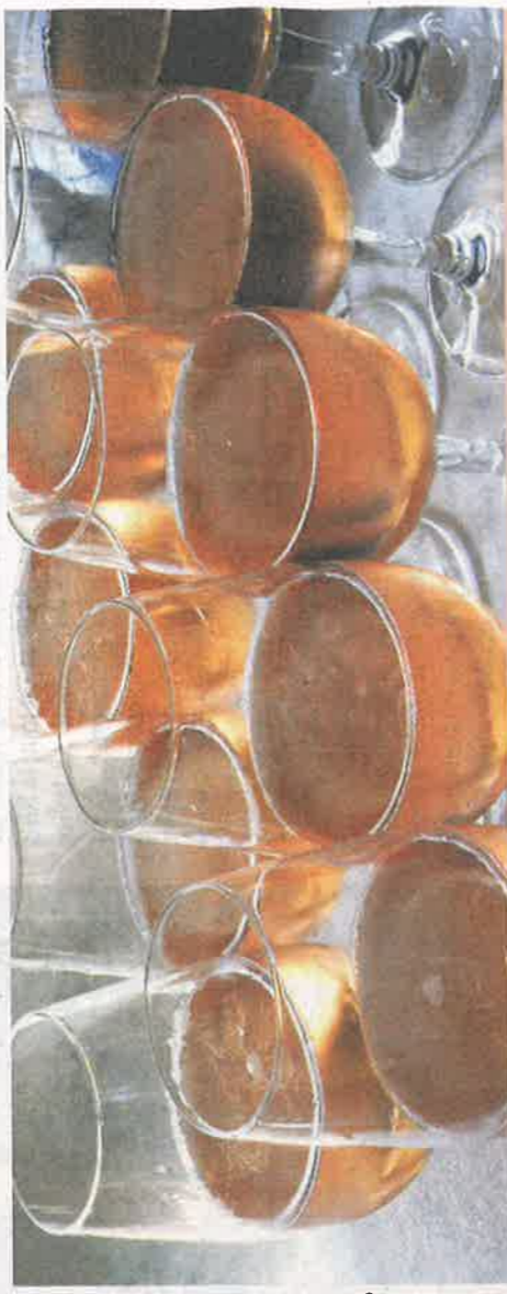
« Notre production se tourne de plus en plus vers le rosé », notait le président d'Inter-Med, Thierry Icard, lors de son rapport moral, à l'occasion de l'assemblée générale de la fédération, qui se déroulait à Salon-de-Provence. Avec les effervescents, ce sont les deux piliers de développement de l'IGP pour les années à venir.

Revenant sur les campagnes 2017 et 2018, impactées respectivement par la sécheresse et la pluie (voir graphique), le président a salué ce retour à la normale. En effet, la campagne actuelle retrouve des couleurs, avec un prix moyen autour de 118 €/hl pour les rosés vrac, un prix « que l'on espère mature », le tout avec des stocks « au plus bas » : en effet, au 31 juillet 2018, l'ODG enregistrait 205 061 hectolitres de stocks, dont 60 449 hl de rosé (2,4 mois de production), 121 597 hl de rouge (12 mois)