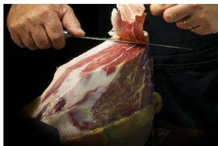
Jambon noir de Bigorre Porc noir de Bigorre