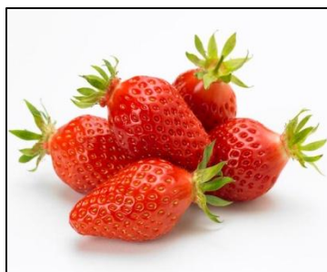
Fraises (LA 01/17)