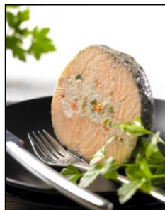
Saumon farci (LA 02/17)