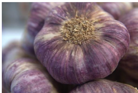
Ail violet de Cadours